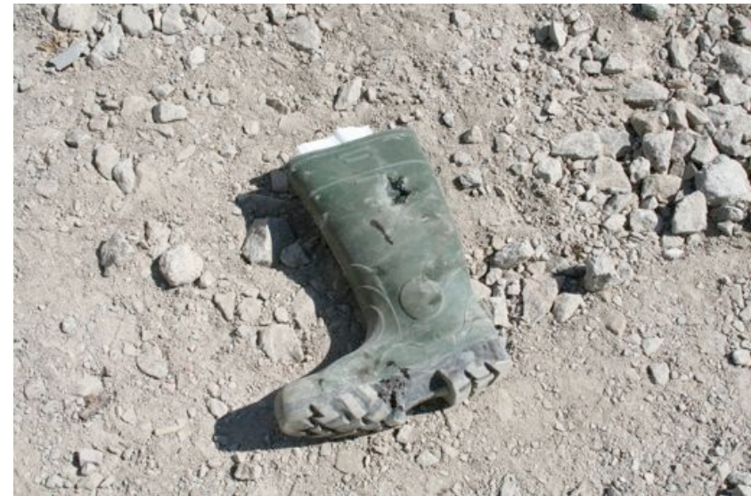
Destian työmaa Kotkassa 26.5.2008